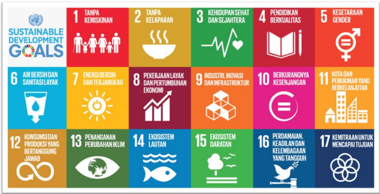
Gambar 3.1 Tujuan Pembangunan Berkelanjutan/ Sustainable Development Goals (TPB/SDGs)

Badan Kepegawaian Daerah Provinsi DKI Jakarta memiliki keterkaitan erat terhadap 3 (tiga) tujuan dari 17 Tujuan TPB/SDGs. 3 (tiga) tujuan tersebut yaitu tujuan nomor 5, 16, dan 17: